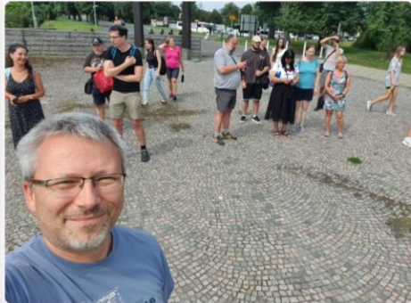
Vzpomínka na společný sborový výlet do Terezína (sobota 20. července 2024).