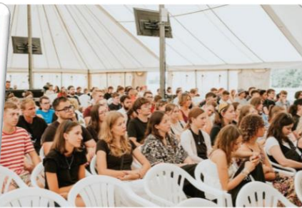
KRISTFEST 2024, středisko KC Immanuel (22.-26. července 2024).